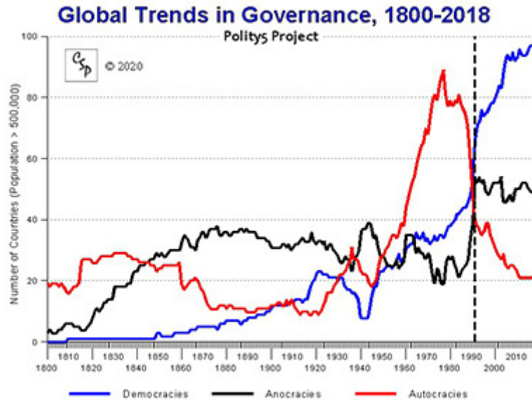
Fyrirsögn: Mynd 1. Þróun lýðræðis, fáræðis og einræðis 1800-2018 Lóðréttur ás: Fjöldi landa (fólksfjöldi yfir 500.000) Láréttur ás: Lýðræðisríki, Fáræðisríki, Einræðisríki Heimild: Polity5 Project.